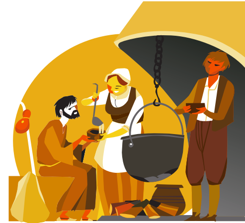
15. ДОМ И КРЕСТ ДЕЛ-ТОРТ Рядом с этим крестом находился дом, где ему часто давали приют и предлагали горячий бульон; миска, из которой он ел, сохранилась до наших дней. В начале февраля 1523 г. Игнатий де Лойола покинул Манресу и, пройдя через лес под названием Марсетес, отправился в селение Понт-де-Виломара.