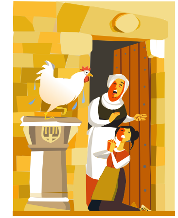
16. КОЛОДЕЦ ПОУ-ДЕ-ЛА-ГАЛЬИНА ЛЕГЕНДА На улице Соберрока находится колодец, в котором в 1602 г. утонула упавшая туда курица. Девочка, которая присматривала за ней, очень боялась, что мачеха накажет ее за пропажу курицы, и попросила святого Игнатия оживить ее. Как гласит легенда, именно так и случилось.