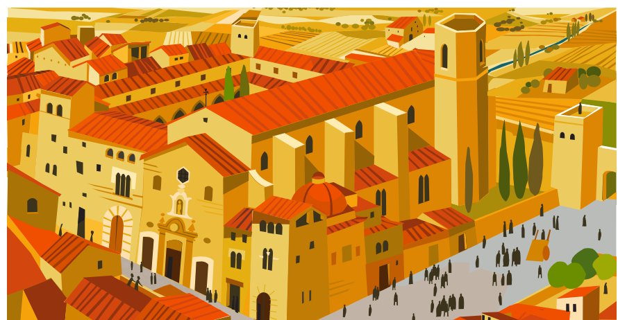
9. МОНАСТЫРЬ БРАТЬЕВ-ПРОПОВЕДНИКОВ На площади, которая в наши дни носит имя Святого доминиканского ордена, где Игнатию дали приют на несколько недель. Здесь у него возникли многочисленные сомнения и чувство разочарования, и он заболел.