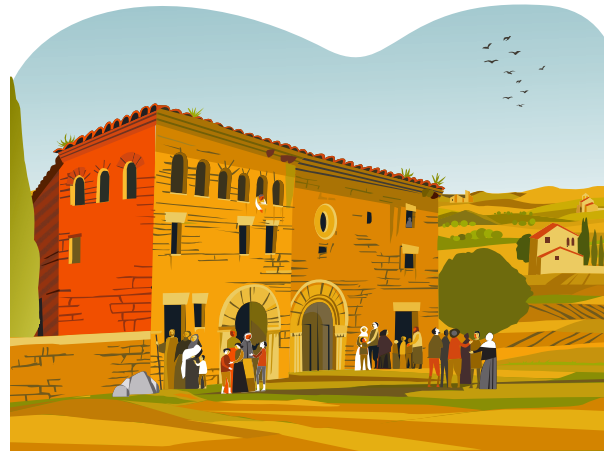
4. БЫВШИЙ ГОСПИТАЛЬ СВЯТОЙ ЛУЦИИ Его приняли в госпитале Святой Луции, который находился за городскими стенами. Именно здесь он прожил большую часть времени, помогая ухаживать за бедняками и больными. Он ходил в рубище и не следил за своей внешностью. Поэтому местные жители называли его «ЧЕЛОВЕКОМ В РУБИЦЕ». В настоящее время здесь возвышается часовня Дел-Рапте.