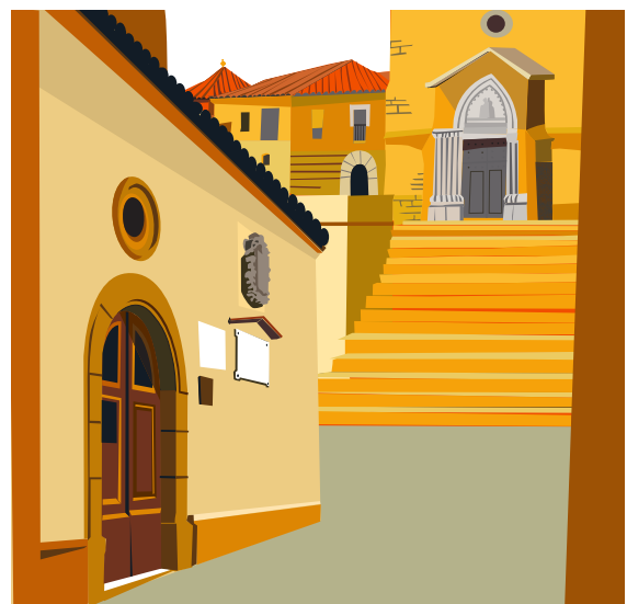
10. ЧАСОВНЯ СВЯТОГО ИГНАТИЯ ЗАБОЛЕВШЕГО Богатая семья Амигант давала приют больным в отдельном здании, которое называли Л'Оспиталет. Здесь дважды принимали заболевшего святого Игнатия и заботились о нем. Он также жил в доме семьи Каньельсе по улице Соберрока, 30.

В здании Л'Оспиталет в наши дни находится часовня Святого Игнатия Заболевшего, расположенная у подножия лестницы церкви Дел-Карме, вблизи площади Мажор.