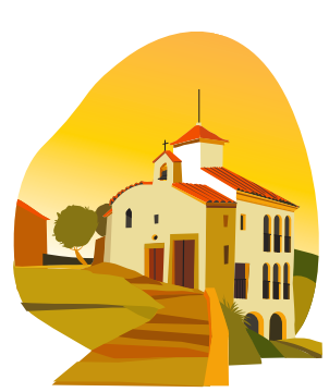
11. МОНАСТЫРЬ СВЯТОЙ КЛАРЫ, КРЕСТ ДЕ-ЛА-КУЛЬЯ 12. ВИЛАДОРДИС, 13. ПРИОРАТ СВЯТОГО ПАВЛА Святой Игнатий обычно ходил в Виладордис. По дороге он останавливался перед монастырем Святой Клары, чтобы послушать песнопения монашек, а затем отправлялся по «королевской дороге» к кресту Де-ла-Кулья и спускался к церкви Ла-Салут-де-Виладордис, где он размышлял и иногда проводил всю ночь в молитвах. Кроме того, он также посещал приорат Святого Павла, принадлежавший цистерцианскому ордену и расположенный вблизи реки Карденер. Приор был ответственным за госпиталь Святой Луции и наставником Игнатия.