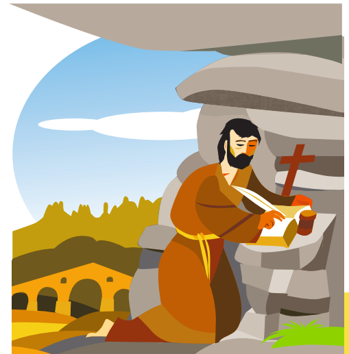
8. ЛА-КОВА Он часто уединялся в одной из естественных пещер на берегу реки Карденер, чтобы размышлять, молиться и писать. В наши дни здесь находятся церковь Ла-Кова и духовный центр.