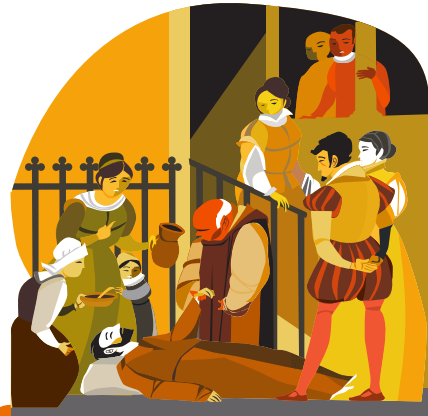
«ЭЛ-РАПТЕ» Однажды вечером, в часовне госпиталя, он впал в беспамятство и на протяжении восьми дней и ночей неподвижно лежал на земле. Это событие стало известно как «эл-рапте», 'духовное иступление'. Именно тогда его посетили видения того, что он должен сделать в будущем.