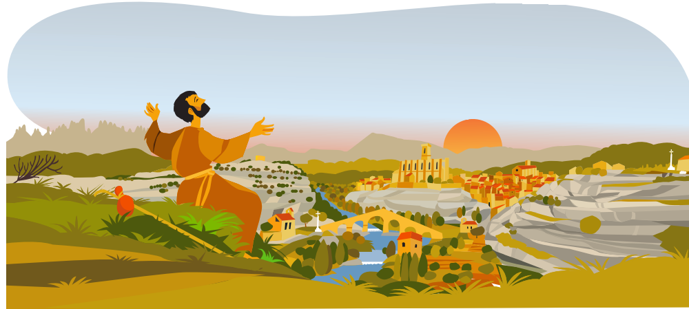
14. ПОУ-ДЕ-ЛЬЮМ / ПРОЗРЕНИЕ НА КАРДЕНЕРЕ По дороге в приорат Святого Павла произошло так называемое «Прозрение на Карденере». По собственным словам святого Игнатия, это было божественное просветление, благодаря которому он многое понял. Это помогло ему окончательно найти жизненный путь, по которому он должен был идти. Все это, по-видимому, произошло в месте, известном под названием Поу-де-Льюм ('Колодец света'), вблизи креста Дел-Торт, к которому Игнатий направился после этого события, чтобы воздать благодарность.