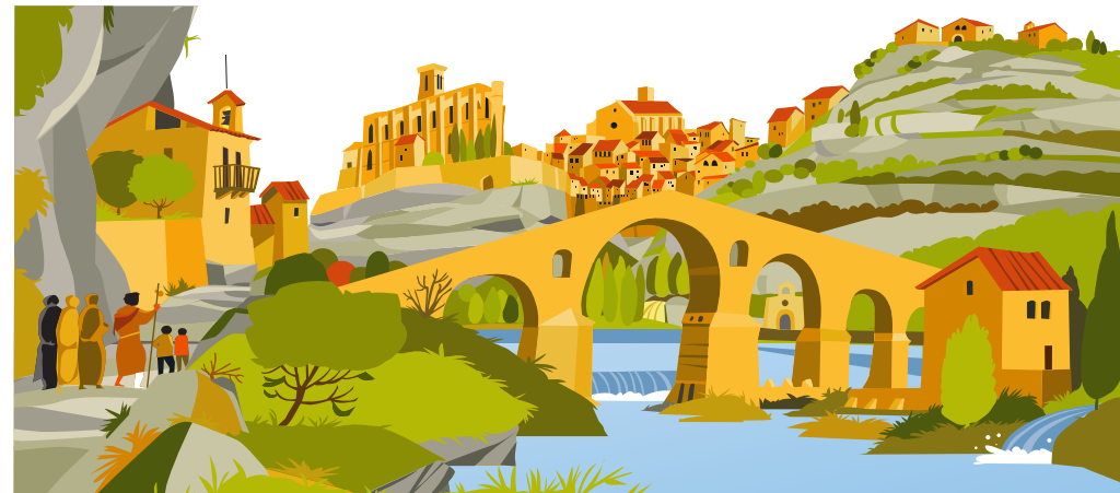
2. ЧАСОВНЯ И КРЕСТ ДЕ-ЛА-ГИА Он остановился для молитвы в часовне Де-ла-Гиа. Это был праздничный день, и здесь собрались местные жители, чтобы отметить его.