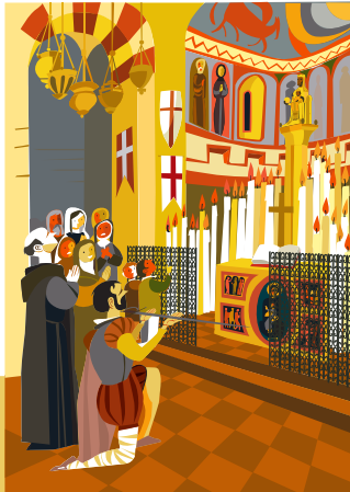
1. МОНТСЕРАТ После ночного бдения Игнатий де Лойола подарил свою одежду бедняку и спустился в Манресе. Это произошло во вторник 25 марта 1522 г.