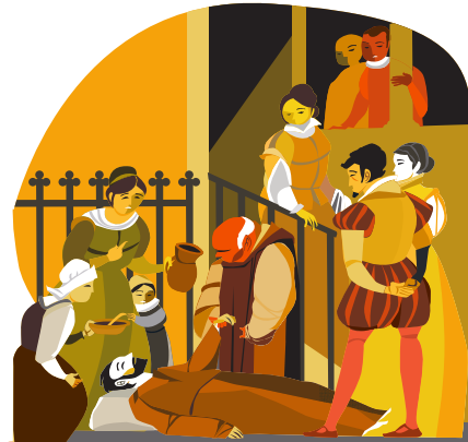
«ЭЛ-РАПТЕ» Однажды вечером, в часовне госпиталя, он впал в беспмятство и на протяжении восьми дней и ночей неподвижно лежал на земле. Это событие стало известно как «эл-рапте», 'духовное иступление'. Именно тогда его посетили видения того, что он должен сделать в будущем.

5. БАЗИЛИКА ЛА-СЕУ Святой Игнатий ходил к мессе в базилику Ла-Сеу, где созерцал образ Богородицы Марс-де-Дей-де-л'Алба. Игнатий просил милостиво и раздавал ее беднякам.