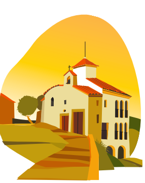
11. МОНАСТЫРЬ СВЯТОЙ КЛАРЫ, КРЕСТ ДЕ-ЛА-КУЛЬЯ, 12. ВИЛАДОРДИС, 13. ПРИОРАТ СВЯТОГО ПАВЛА Святой Игнатий обычно ходил в Виладордис. По дороге он останавливался перед монастырем Святой Клары, чтобы послушать песнопения монашек, а затем отправлялся по «королевской дороге» к кресту Де-ла-Кулья и спускался к церкви Ла-Салут-де-Виладордис, где он размышлял и иногда проводил всю ночь в молитвах. Кроме того, он также посещал приорат Святого Павла, принадлежавший цистерцианскому ордену и расположенный вблизи реки Карденер. Приорат был ответственным за госпиталь Святой Луции и наставником Игнатия.