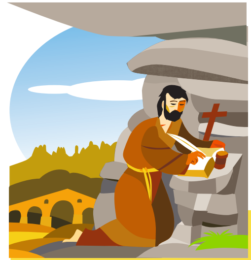
8. ЛА-КОВА Он часто уединялся в одной из естественных пещер на берегу реки Карденер, чтобы размышлять, молиться и писать. В наши дни здесь находятся церковь Ла-Кова и духовный центр.