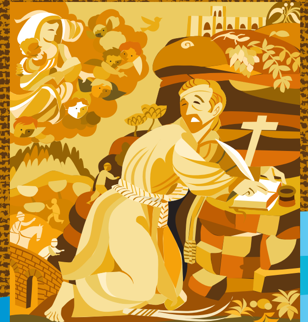
DISENY GRÀFIC I IL·LUSTRACIÓ: JIMENE GUBIARANS 2015_1