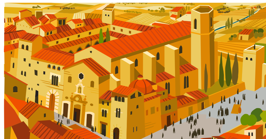
9.ドミニコ修道士会修道院 当時、現在のサン・ドメネク（聖ドミニコ）広場には、ドミニコ修道士会修道院が建てられており、そこで何週間か過ごしました。ここでは、疑問がわき、あまりに意気消沈してしまったために、病気にかかってしまいました。