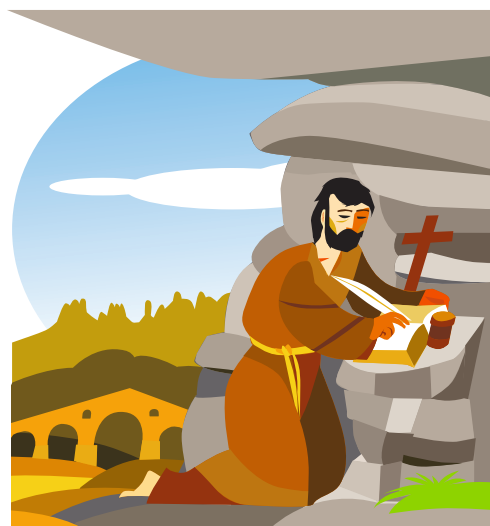
8.ラ・コバ（洞窟） 瞑想し、祈り、著作を行うために過ごした洞窟の1つが、カルデネル川のほとりにあります。 現在、ここにはラ・コバ教会と国際信仰センターが建てられています。