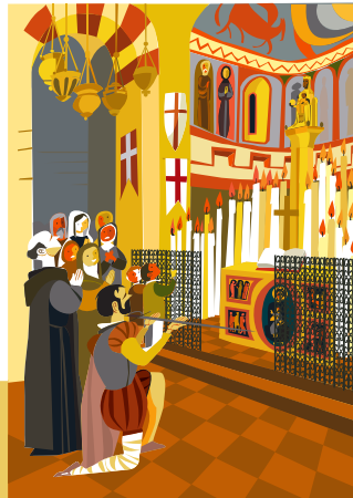
1.モンセラット 眠れない一晩を過ごした翌日、イグナチオ・デ・ロヨラは、自分が身に着けていたものを貧しい人にあげ、マンレサへと向かいました。 1522年3月25日の火曜日のことでした。