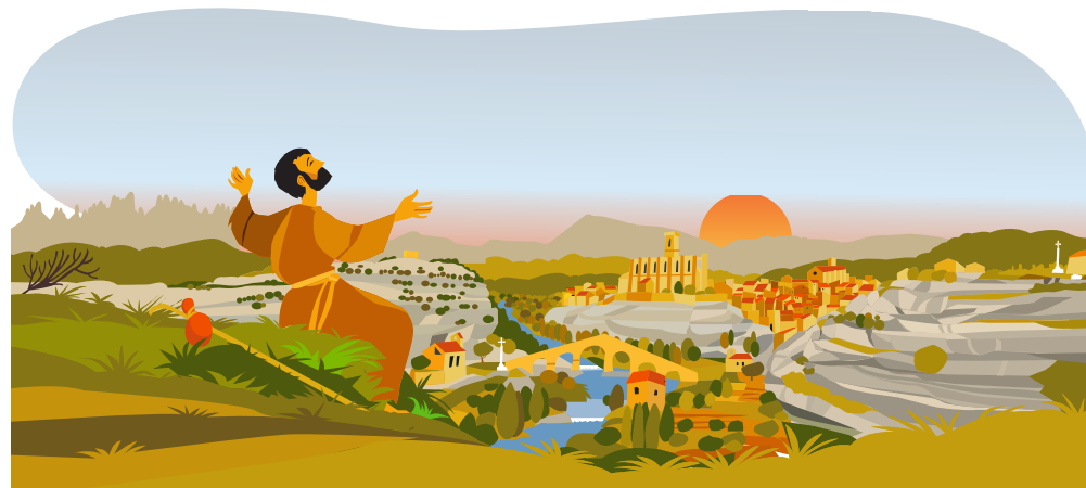
14. ボウ・デ・ルムとエクシミア・イラストラシオ・デル・カルデネル（光の井戸とカルデネル川における素晴らしい照明） 聖パウロ小修道院に向かう途中で「カルデネル川における素晴らしい照明」が起きました。彼自身の説明によると、超自然的に突然ひらめきが起これ、これによって多くのことが解明し、終に今後進むべき道が理解できるようになったと言います。 これらは、クレウ・デル・トルト（トルトの十字標）近くの「ボウ・デ・ルム」で起こったようで、この現象が起きた後に感謝を捧げる目的でこの場所を訪れています。