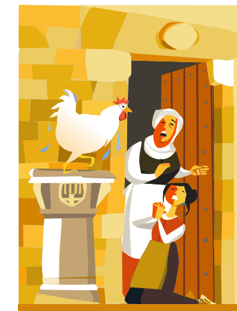
16.エル・ポウ・デ・ラ・ガジーナ（ニワトリの井戸） 伝説 ソブレロカ通りにある井戸に、1602年に1羽のニワトリが落ちてしまい、溺れ死んでしまいました。 そのニワトリの世話をしていた女の子は、継母に怒られるのではないかと心配になり、聖イグナチオにニワトリを生き返してほしいと頼みました。 すると、伝説によれば、ニワトリは息を吹き返したということです。