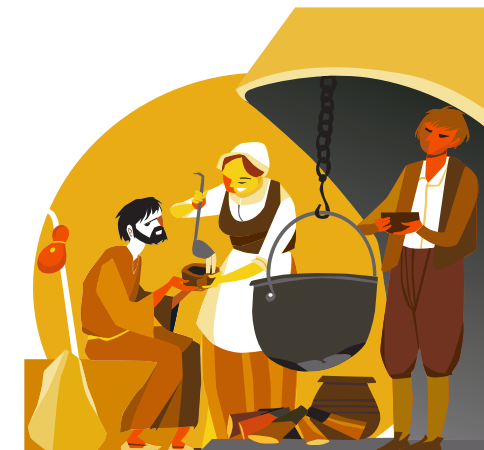
15.ラ・カサとクレウ・デル・トルト（トルトの十字標） 街の境界を示すこの十字標の脇には、聖イグナチオをよく迎え入れていた家、「ラ・カサ」があり、そこでは暖かい一杯のコンソメが振る舞われ、その時に使われたお椀が今もなお保存されています。1523年の2月の初めにイグナチオ・デ・ロヨラがマンレサを発った際には、マルセテスからポント・デ・ピロマラ（ピロマラ橋）に向けて出発したのでした。