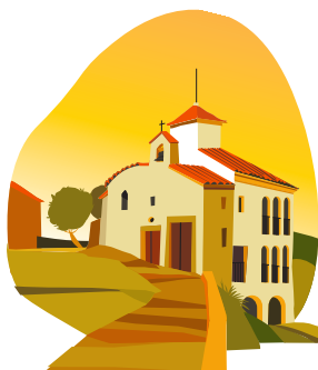
11. 聖クララ会修道院、クレウ・デ・ラ・クーリャ（ラ・クーリャの十字標） 12. ビラドルディス 13. 聖パウロ小修道院 ビラドルディスは良く訪れた場所です。そこに出かけて行く際には、聖クララ会修道院の前に座って修道女たちの歌声を聞いてから、クレウ・デ・ラ・クーリャに向かって主要道路をビラドルディスにあるサルット教会まで歩いて行きました。そこで折り返しにふけたり、夜晩も夜通し救いを求めたりしました。 また、カルデネル川のほとりにあるシトー会聖パウロ小修道院を訪れることもありました。聖ルシア病院の管理も行っていた小修道院長は、イグナチオの師でもありました。