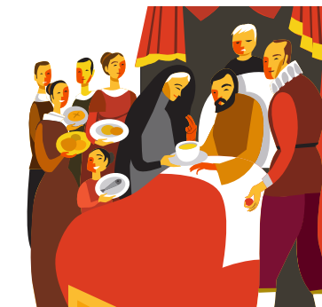
10.カページャ・デ・サン・イグナシ・マラルト（病に倒れた聖イグナチオのチャペル） アミガント家は、いつもスピタレットと呼ばれる建物に病気の人々を集め、助けていたお金持ちの一家でした。 2度にわたってイグナチオ・デ・ロヨラを迎え入れ、看病しています。これは、ソブレロカ通り30番地に家を持っていたカニェルス家も行ったことでした。