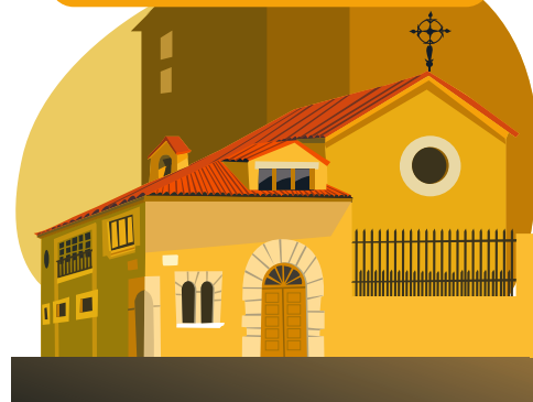
6.カページャ・デル・ラプト（ラプトのチャペル）および 7.旧聖イグナチオ学校（現在の博物館） 聖ルシア病院およびそのチャペルは、スペイン市民戦争中の1936年に破壊されてしまいました。 現在そこには、壊された病院の石を使ってカページャ・デル・ラプトが建てられています。 その後方にある旧聖イグナチオ学校跡地には、現在博物館が建てられています。