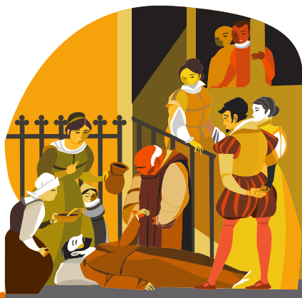
エル・ラプト（ラプトとは、神の啓示を受けた状態のこと） ある晩、病院のチャペルで気を失い、「神の啓示」を受け、8日8晩地面で身動き一つせずに過ごしました。その時に将来やるべきことを理解したのです。