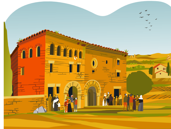
4.旧聖ルシア病院 要塞の外にある貧しい人びとのための病院である聖ルシア病院に迎え入れられました。 ここで多くの時間を過ごし、貧しい人びとや病人を助けました。ぼろを纏い、身なりなど、まったく構うことがありませんでした。 人びとは彼のことを「ぼろを纏った男」と呼んでいました。 現在、そこにはカページャ・デル・ラプト（ラプトのチャペル）が建てられています。