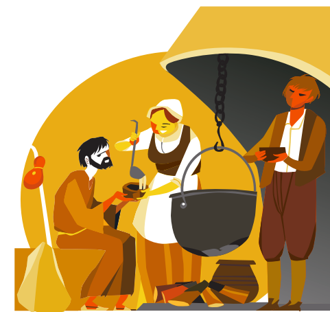
15.ラ・カサとクレウ・デル・トルト（トルトの十字標） 街の境界を示すこの十字標の脇には、聖イグナチオをよく迎え入れていた家、「ラ・カサ」があり、そこでは暖かい一杯のコンソメが振る舞われ、その時に使われたお椀が今もなお保存されています。1523年の2月の初めにイグナチオ・デ・ロヨラがマンレサを離れた際には、マルセテスからポント・デ・ピロマラ（ピロマラ橋）に向けて出発したのでした。