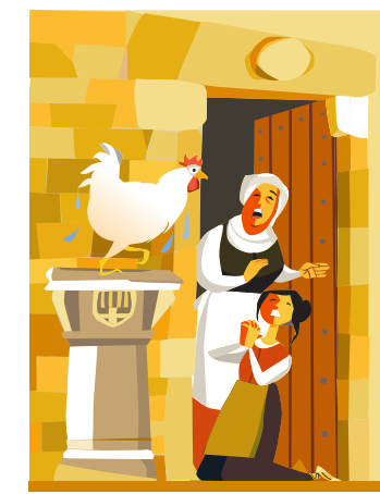
16. エル・ボウ・デ・ラ・ガジーナ（ニワトリの井戸） 伝説 ソブレロカ通りにある井戸に、1602年に1羽のニワトリが落ちてしまい、溺れ死んでしまいました。 そのニワトリの世話をしていた女の子は、継母に怒られるのではないかと心配になり、聖イグナチオにニワトリを生き返らしてほしいと頼みました。 すると、伝説によれば、ニワトリは息を吹き返したということです。