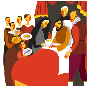
10.カページャ・デ・サン・イグナシ・マラルト（病に倒れた聖イグナチオのチャペル） アミガント家は、いつもスピタレットと呼ばれる建物に病気の人々を集め、助けていたお金持ちの一家でした。 2度にわたってイグナチオ・デ・ロヨラを迎え入れ、看病しています。これは、ソブレロカ通り30番地に家を持っていたカニェルス家も行ったことでした。