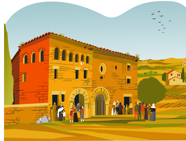
4.旧聖ルシア病院 要塞の外にある貧しい人びとのための病院である聖ルシア病院に迎え入れられました。 ここで多くの時間を過ごし、貧しい人びとや病人を助けました。ぼろを纏い、身なりなど、まったく構うことがありませんでした。 人びとは彼のことを「ぼろを纏った男」と呼んでいました。 現在、そこにはカページャ・デル・ラプト（ラプトのチャペル）が建てられています。